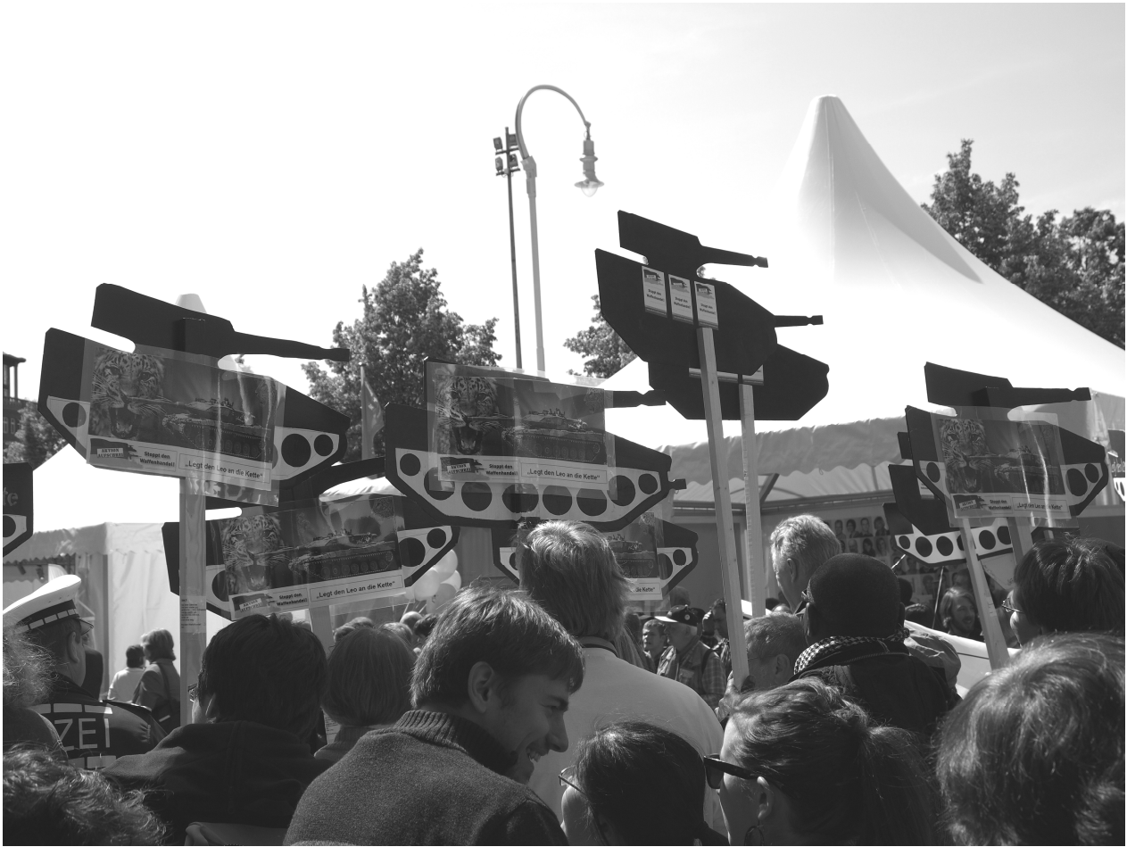
Demonstration gegen Rüstungsexporte

schreckt zur Durchsetzung seiner Interessen auch vor dem Einsatz von Gewalt nicht zurück – sei es in Nachbarstaaten oder auch gegen die eigene Bevölkerung. Rüstungslieferungen dorthin sind unverantwortlich. Sie bedrohen den Frieden in der ganzen Region.